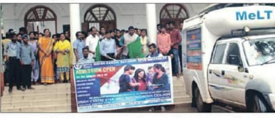
ଉଚ୍ଚଶିକ୍ଷାରୁ ବଞ୍ଚିତ ଗ୍ରାମାଞ୍ଚଳ ଛାତ୍ରଛାତ୍ରୀଙ୍କ ପାଇଁ ସହାୟକ ହେବ ମୁକ୍ତ ଶିକ୍ଷା